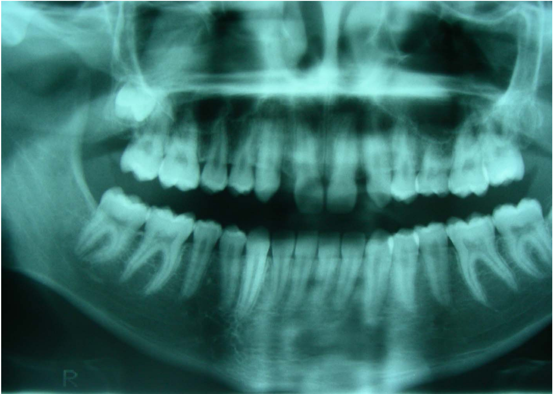
Agenesia incisivi laterali superiori