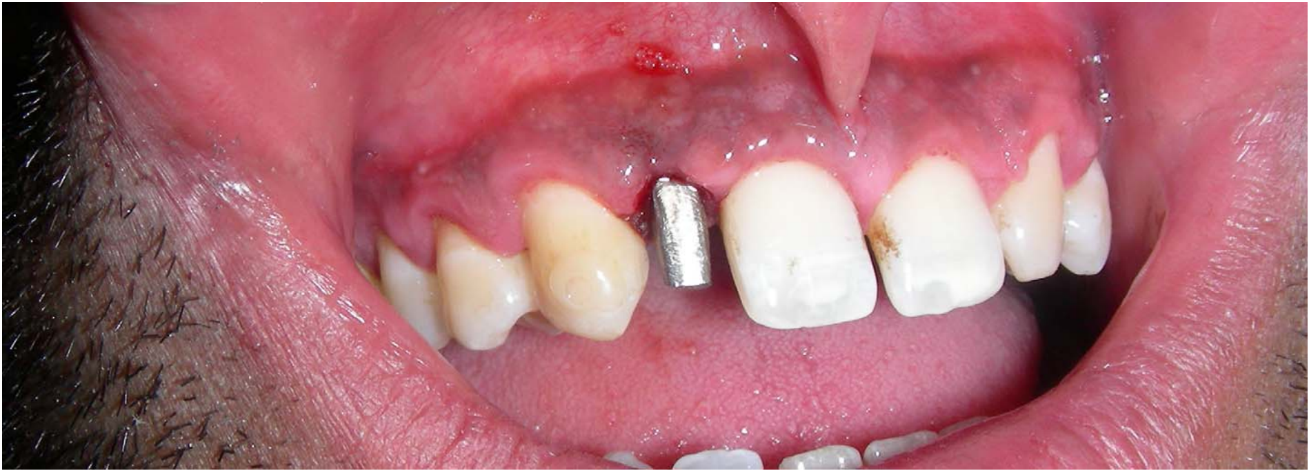
Posizionamento di dente provvisorio fisso