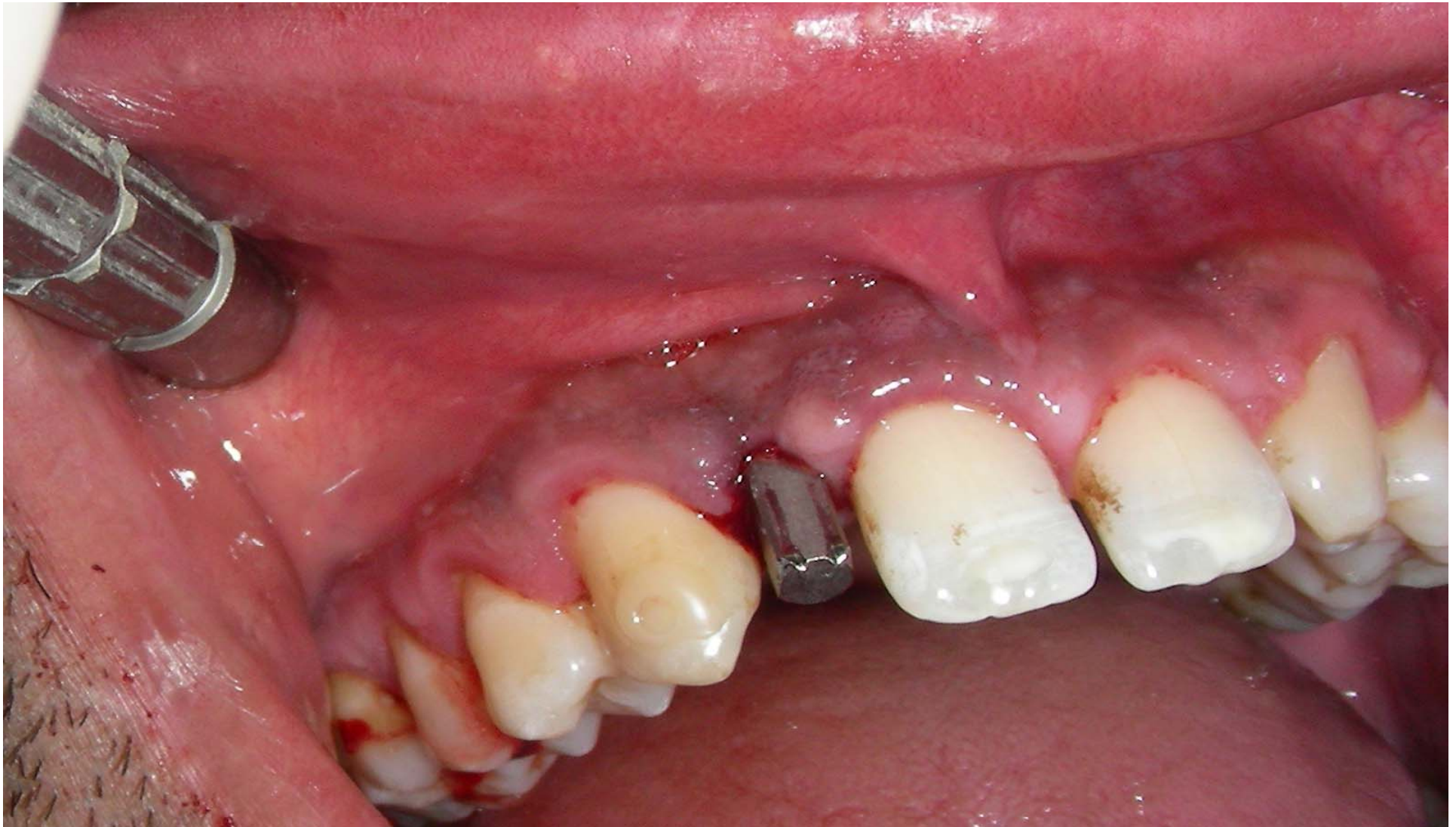
Inserimento Impianto a carico immediato nella stessa seduta