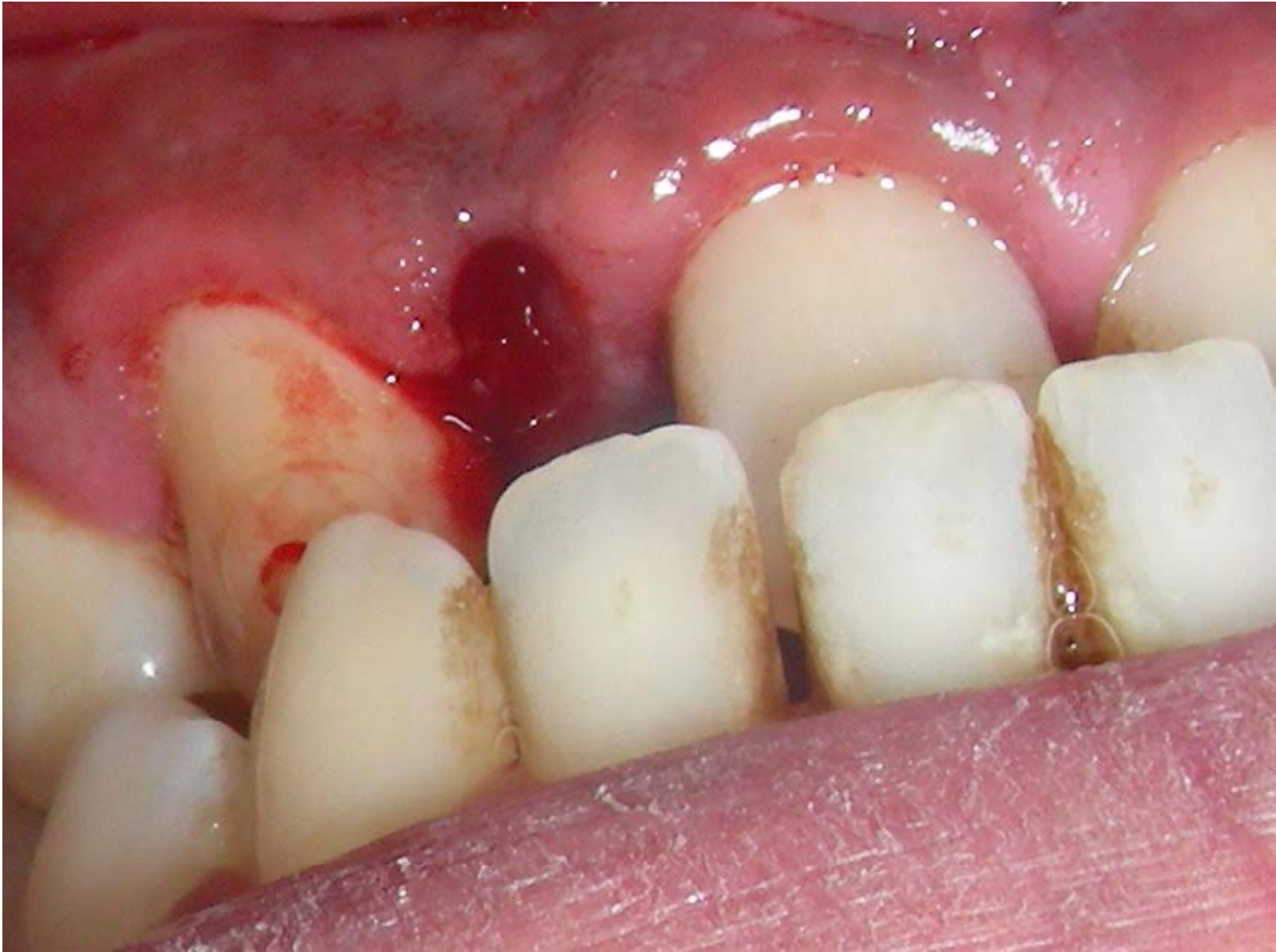
Estrazione del dente