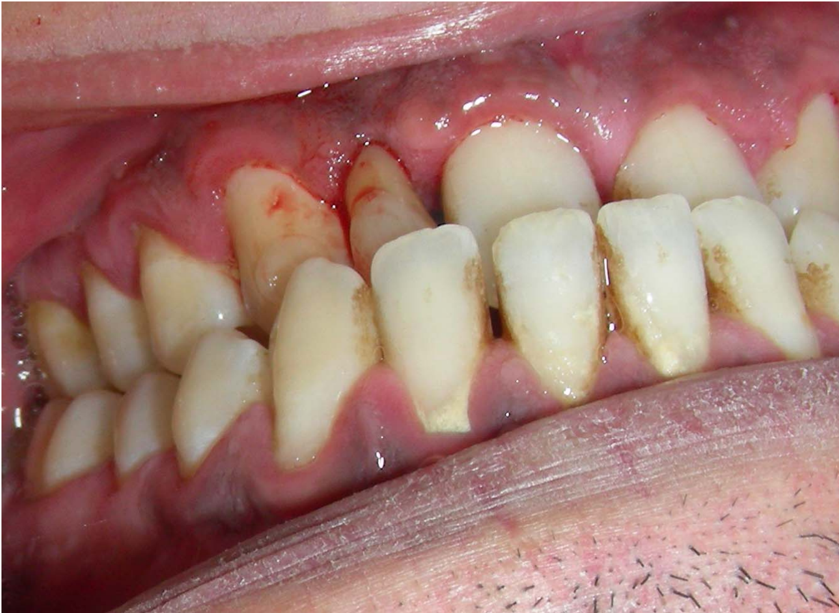
Mobilità del dente deciduo in paziente con malocclusione di III classe